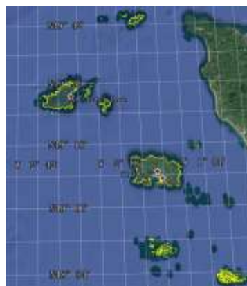
图 2 海峡群岛数据可视化图(.kmz 格式)

海峡群岛主要由泽西岛 (Jersey)、根西岛 (Guernsey)、奥尔德尼岛 (Alderney) 和萨克岛 (Sark) 和法属 Chausey 岛等岛屿组成, 面积大于 70\text{ m}^2 的岛屿和岛礁有 730 个 [4] 。泽西岛是群岛中最大的岛屿, 东距科唐坦半岛约 20 km, 北距根西岛约 30 km, 面积 121.63\text{ km}^2 , 海岸线长 100.25 km。泽西岛周边有 2 座无人岛群, 分别是群岛最南端的曼基耶群岛和最东端的艾奎胡群岛 (Ecrehou)。群岛中第二大岛是根西岛, 有时也译为格恩西岛, 位于群岛