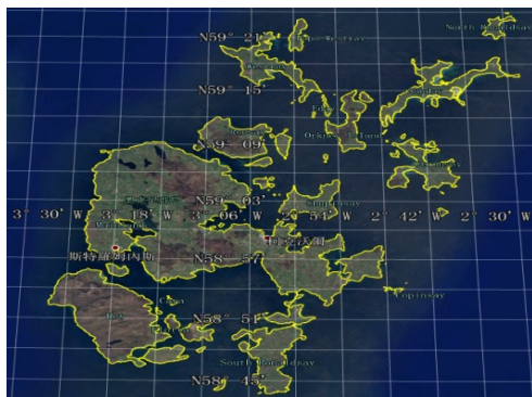
图 1 奥克尼群岛地理位置数据图 (.shp 格式)

奥克尼群岛由 104 个岛屿和岩礁组成 (最小面积 72 m 2 ) [3] , 主要岛屿包括: 梅恩兰岛 (Mainland Island)、霍伊岛 (Hoy)、桑迪岛 (Sanday)、韦斯特雷岛 (Westray)、劳赛岛 (Rousay)、斯特朗赛岛 (Stronsay)、埃代岛 (Eday)、沙平赛岛 (Shapinsay)、弗洛塔岛 (Flotta)、帕帕韦斯特雷岛 (Papa Westray)、北罗纳德赛岛 (North Ronaldsay)、埃吉尔赛岛 (Egilsay)、格雷姆赛岛 (Graemsay)、怀尔岛 (Wyre)、法拉岛 (Fara)、盖尔赛岛 (Gairsay)、卡尔夫伊代岛 (Calf of Eday)、法雷岛 (Faray)、斯沃纳岛 (Swona)、奥斯凯里岛 (Auskerry)、卡瓦岛 (Cava)、帕帕斯特隆赛岛 (Papa Stronsay)、艾因哈罗岛 (Eynhallow)、斯维塔岛 (Switha)、赫尔利阿霍尔姆 (Helliar Holm)、霍尔姆法雷岛 (Holm of Faray)、穆科勒格林霍尔 (Muckle Green Holm)、霍尔姆胡伊普岛 (Holm of Huip)、霍尔姆帕帕岛 (Holm of Papa)、达姆塞岛 (Damsay)、侯伊岛 (Holm of Scockness)、