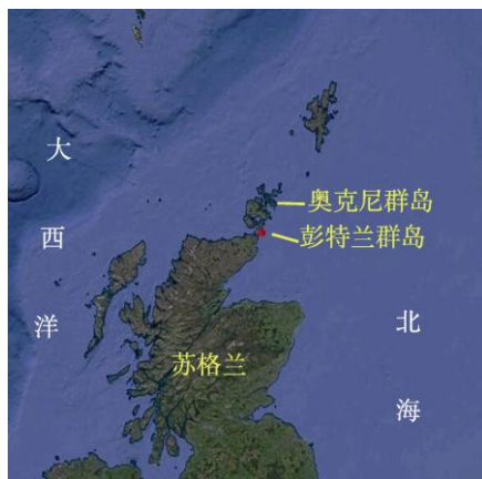
图 1 彭特兰群岛地理位置图

彭特兰群岛由 4 个岛屿和 3 个岩礁组成 (最小岩礁面积 135 m 2 ) [4] 。其中, 主要岛屿包括: 墨克勒斯凯利岛 (Muckle Skerry)、鲁余斯凯利岛 (Lough Skerry)、科莱泰克斯凯利岛 (Clettack Skerry) 和小斯凯利岛 (Little Skerry) (图 2)。彭特兰群岛各岛屿及岩礁的地理坐标、面积和海岸线长度见表 1。