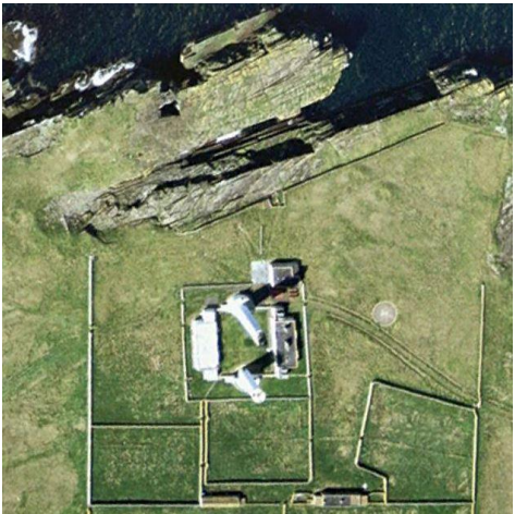
图 3 Google Earth 影像中位于墨克勒岛上的彭特兰群岛灯塔

该数据集是在 Google Earth 遥感卫星影像及相关地图的基础上研发完成。数据集以 .kmz 和 .shp [7] 等数据格式存储，由 14 个数据文件组成，数据量为 119 KB（压缩为 2 个文件，47.3 KB）。