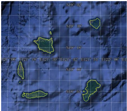
图 2 巴布延群岛数据可视化图 (Google Earth .kmz 格式)

收稿日期: 2018-04-16; 修订日期: 2018-05-05; 出版日期: 2018-06-25