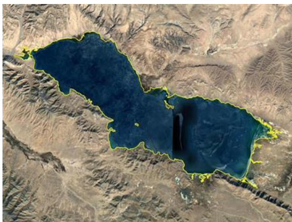
图 1 冬给措纳湖地理位置数据图 (.kmz 格式)

冬给措纳湖又称托索湖、黑海, 位于青海省果洛自治州玛多县境内 (“玛多” 藏语意为“黄河源头”)。冬给措纳湖的湖水淹没地理范围介于 35^{\circ}12'33''\text{N} – 35^{\circ}23'2''\text{N} , 98^{\circ}20'52''\text{E} – 98^{\circ}44'54''\text{E} 之间 [1] (图 1–2)。冬给措纳湖位于昆仑山脉东端, 阿尼玛卿山(南)和布尔汗布达山(北)之间 [2] 。位于冬给措纳湖南面的阿尼玛卿山将冬给措纳湖与黄河源扎陵湖、鄂陵湖隔开。冬给措纳湖是柴达木盆地南侧香日德河上游托素河穿越形成的较大湖泊, 它是由于东昆仑造山构造的断陷作用形成的一处大型内陆高原淡水湖泊, 平均海拔高度 4,090 m, 南北宽 10 km, 东西长 45 km, 湖水呈深兰色, 淡水, 可饮用, 湖中盛产湟鱼 [3] 。冬给措纳湖底凸凹不平, 湖底物质组成不同, 有泥底, 沙底, 石底和草底。