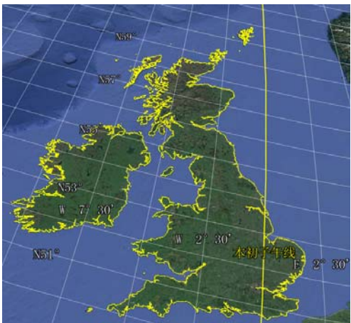
图 2 不列颠群岛数据可视化图 (.kmz 格式)

不列颠群岛除了两个主要大岛大不列颠 (Great Britain) 和爱尔兰岛 (Ireland) 外, 周围其他岛屿还包括 [2] : 刘易斯岛 (Isles of Lewis)、斯凯岛 (Isles of Skye)、马尔岛 (Isle of Mull)、艾莱 (Islay)、南罗纳德赛岛 (South Ronaldsay)、马恩岛 (Isle of Man)、阿兰岛 (Arran)、怀特岛 (Isle of Wight)、巴勒沙尔 (Baleshare)、耶尔岛 (Yell)、基尔 (Keel)、霍伊岛 (Hoy)、