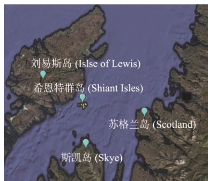
图 1 希恩特群岛 (Shiant Isles) 地理位置数据图 (.kmz 格式)

希恩特群岛由加布艾伦岛 (Garbh Eilean) [5] 、艾伦安泰格岛 (Eilean an Taighe) [6] 和艾伦穆雷岛 (Eilean Mhuire) [7] 三个大岛及 18 个小岛和岛礁组成。其中, 面积最大的岛屿是加布艾伦岛, 面积 0.98 km 2 , 其次是艾伦安泰格岛, 面积 0.66 km 2 , 艾伦穆雷岛位居第三, 面积 0.42 km 2 。一系列小岛包括: 加尔卡莫尔岛 (Galca Mor)、加尔塔