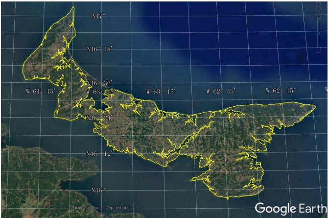
图 2 爱德华王子岛地理位置数据图 (.kmz)

该数据集是基于 Google Earth 遥感影像全球多尺度海陆 (岛) 岸线数据集 (2015), 结合加拿大相关地图完成。数据集以.kmz 和.shp 数据格式存储, 由 26 个数据文件组成, 数据量 7.32 MB (压缩为 3 个文件, 5.05 MB)。